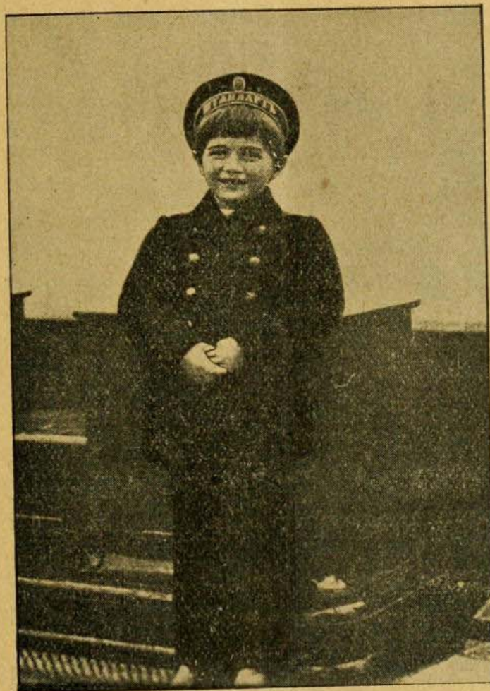
Е. И. В. Наслѣдникъ Цесаревичъ — Шефъ Морского Корпуса.