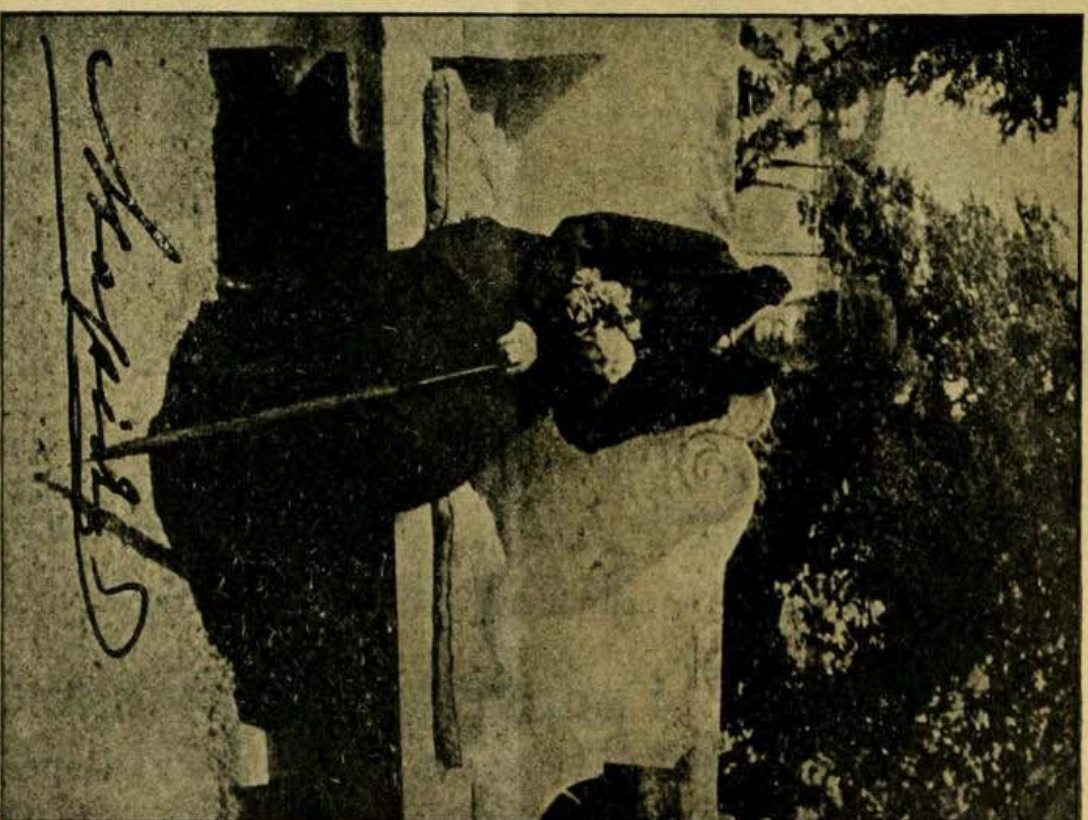
Е. И. В. Государыня Императрица МАРІЯ ФЕОДОРОВНА (съ 1892 по 1928 г. г.). Родилась 14 ноября 1847 г. † 30 сент. 1928 г.