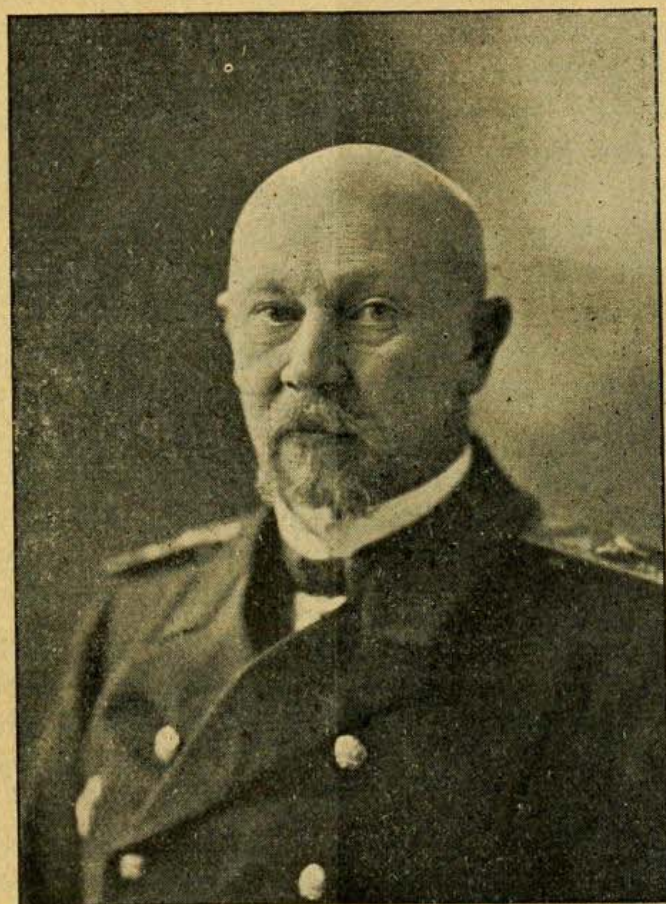
Вице-адмиралъ баронъ В. Н. Ферзенъ.