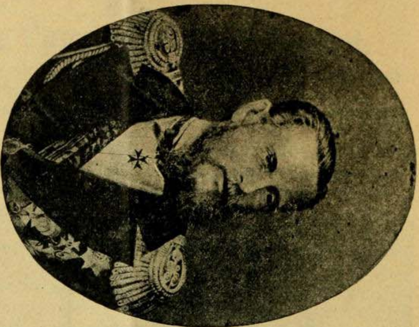
Генералъ-Адмиралъ Е. И. В. Великій Князь КОНСТАНТИНЪ НИКОЛАЕВИЧЪ (съ 1831 по 1892 г. г.). Родился 9 сент. 1827 г. † 13 янв. 1892 г.