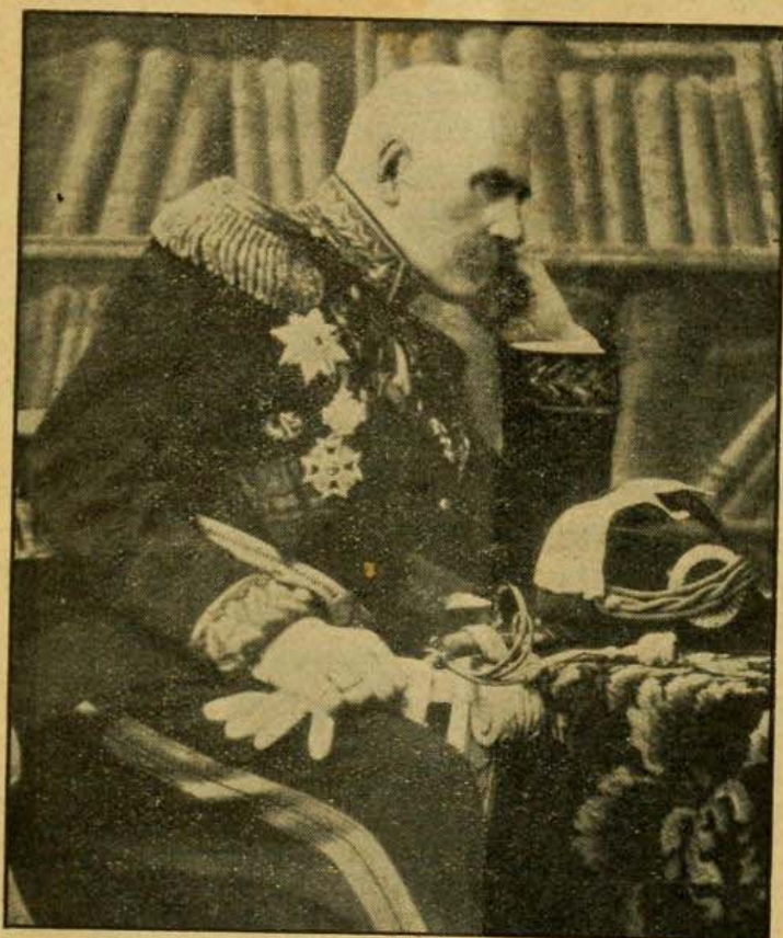
Вице-адмиралъ А. Г. Покровскій.