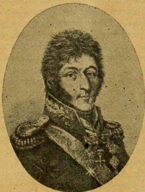
Генералъ отъ инфантеріи кн. П. И. Багратіонъ.