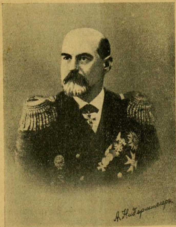
† Вице-адмиралъ А. Г. фонъ Нидермиллеръ.