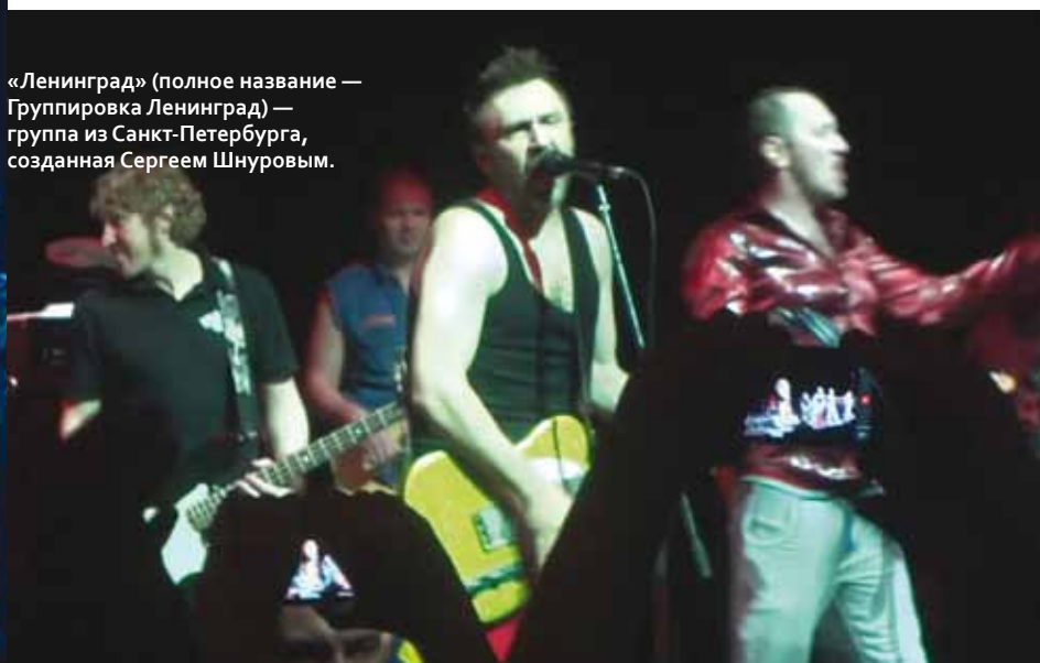
«Ленинград» (полное название — Группировка Ленинград) — группа из Санкт-Петербурга, созданная Сергеем Шнуровым.