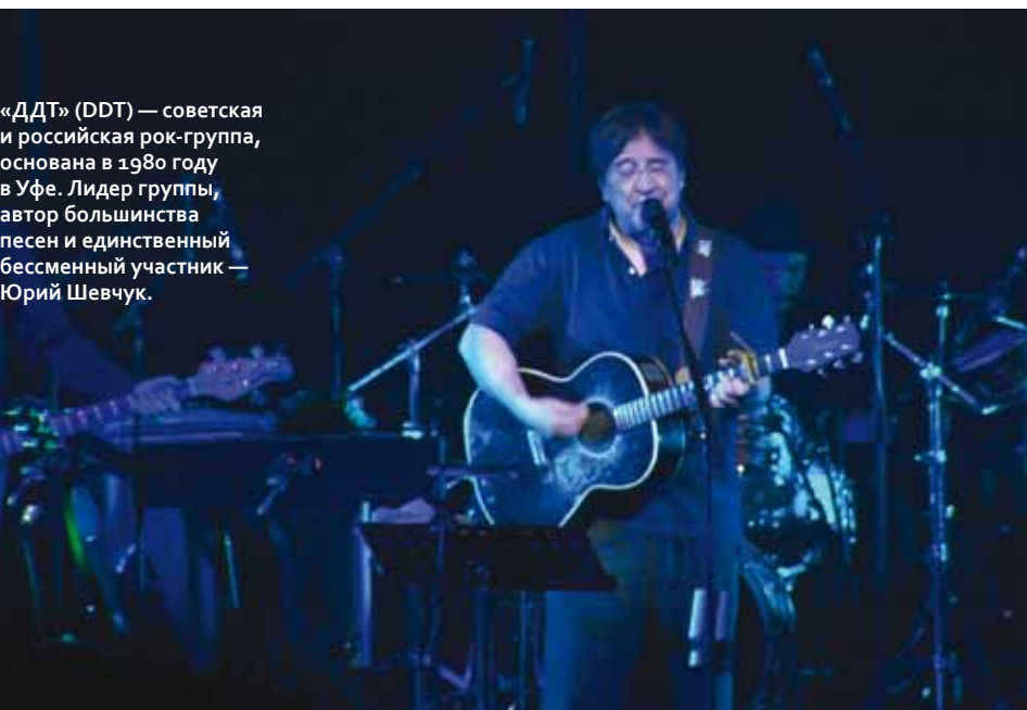
«ДДТ» (DDT) — советская и российская рок-группа, основана в 1980 году в Уфе. Лидер группы, автор большинства песен и единственный бессменный участник — Юрий Шевчук.