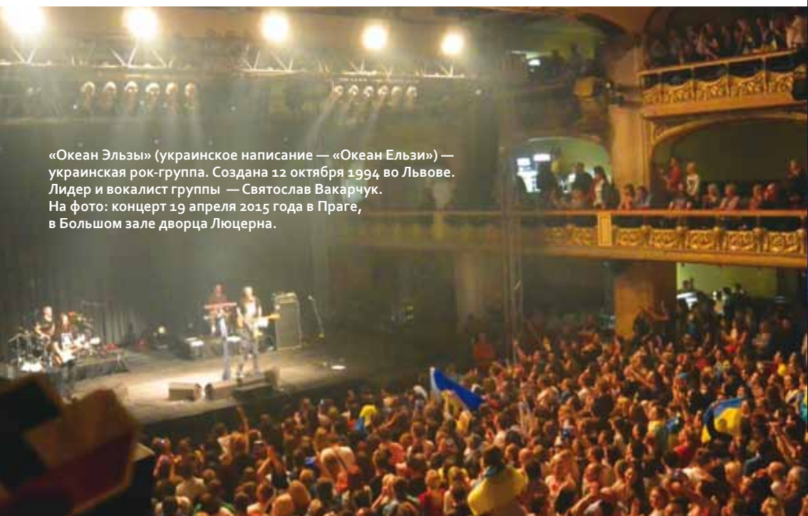
«Океан Эльзы» (украинское написание — «Океан Ельзи») — украинская рок-группа. Создана 12 октября 1994 во Львове. Лидер и вокалист группы — Святослав Вакарчук. На фото: концерт 19 апреля 2015 года в Праге, в Большом зале дворца Люцерна.