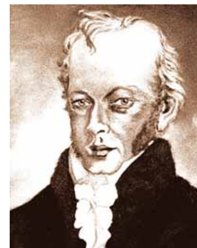
ВОЛЬФГАНГ ФОН КЕМПЕЛЕН (1734—1804).

Но всех нас ожидало потрясение, когда господин фон Кемпелен раскрыл настесь дверцы ящика. При этом он поворачивал автомат во все стороны, освещал его внутренность свечой, приподнимал одежды турка, разрешал заглядывать в любые щели. Когда же мне, несмотря на все старания, не удалось обнаружить ни одного подозрительного предмета величиной хотя бы со шляпу, моему самолюбию был нанесен жестокий удар. Такое же чувство испытывали и остальные зрители, что красноречиво отражалось на их вытянутых лицах. Одна пожилая дама, вспомнив сказки своего далекого детства, горько вздохнула, перекрестилась и отошла к оконной нише прочь от нечистой силы, которая, по ее убеждению, скрывалась в ящике.