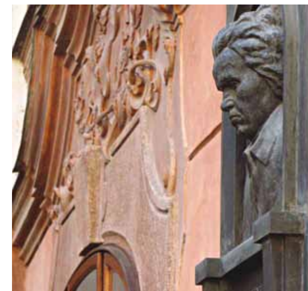
Beethoven Palace. Прага, Lázeňská 11