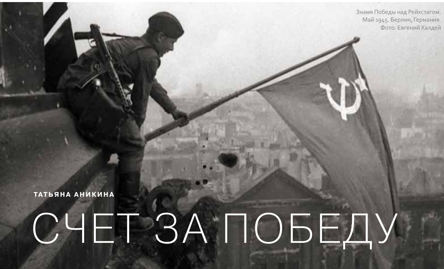
Знамя Победы над Рейхстагом. Май 1945. Берлин, Германия.