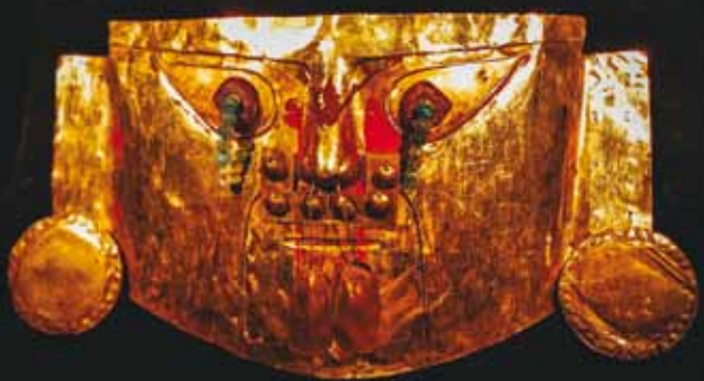
ФОТО: VÝSTAVA ZLATÝ POKLAD INKŮ