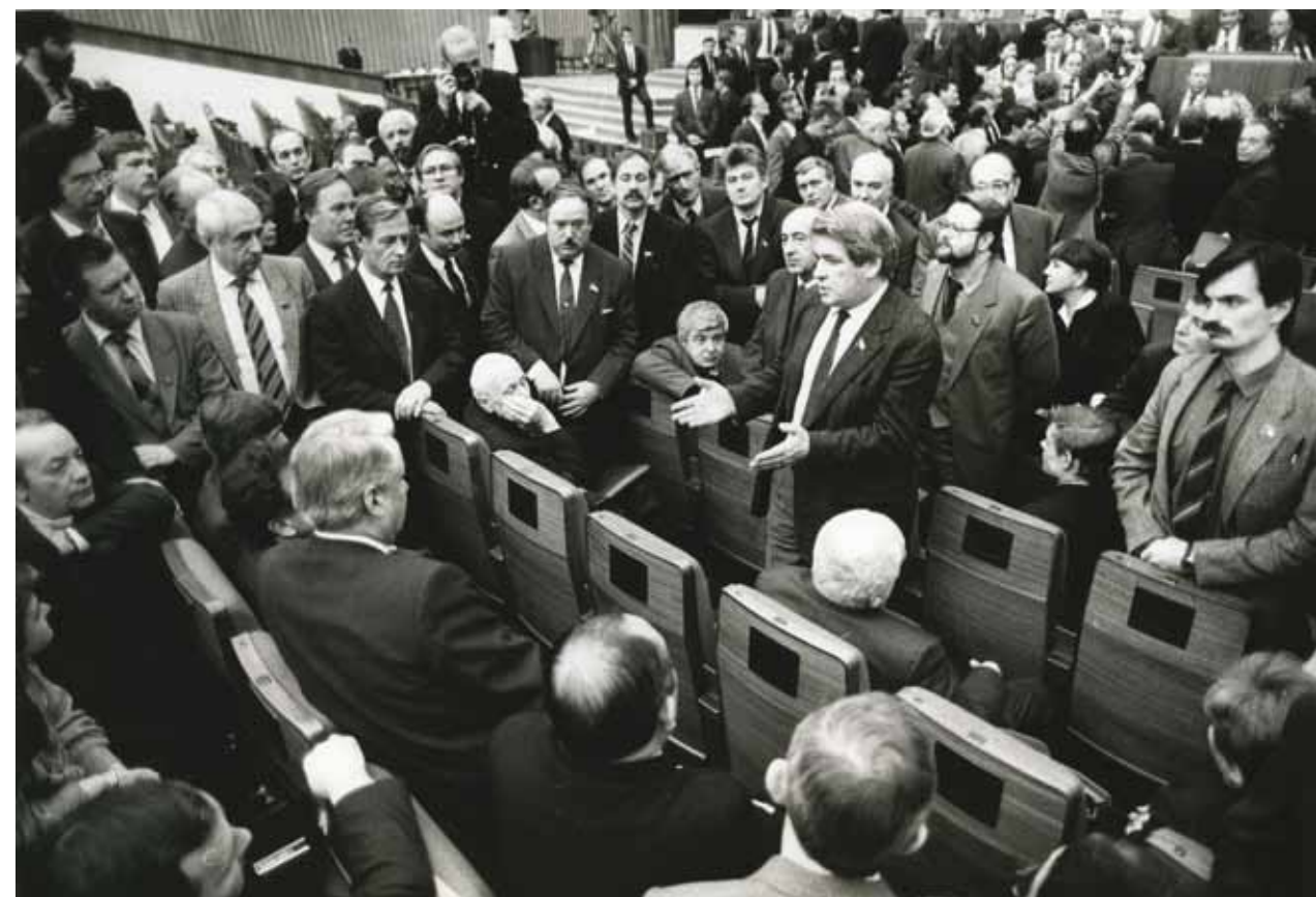
СОВЕЩАНИЕ МЕЖРЕГИОНАЛЬНОЙ ГРУППЫ В ПЕРЕРЫВЕ МЕЖДУ ЗАСЕДАНИЯМИ СЪЕЗДА НАРОДНЫХ ДЕПУТАТОВ СССР. МОСКВА, 1989. МУЗЕЙ СОВРЕМЕННОЙ ИСТОРИИ РОССИИ

Так стоит ли удивляться, что все кризисные явления в СССР — развал производства и сельского хозяйства, нехватка продовольствия,