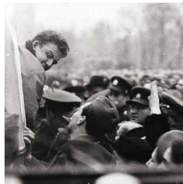
ПРАГА ПРИВЕТСТВУЕТ ЧЕМПИОНОВ. 1949.

Решение было принято властями 11 марта 1950 года в такой спешке, что команда узнала об этом уже в пражском международном аэропорту Рузине. Перед самым вылетом в Лондон от спортсменов потребовали подписать заявление, что они не будут участвовать в чемпионате мира из-за отказа дать визы чехословацким репортерам. Разумеется, команда ничего не подписала и была отправлена по домам. Некоторая надежда на отмену абсурдного распоряжения сохранялась до 13 марта. Однако после официального заявления руководства компартии о неучастии чехословацкой сборной в чемпионате ее не осталось.