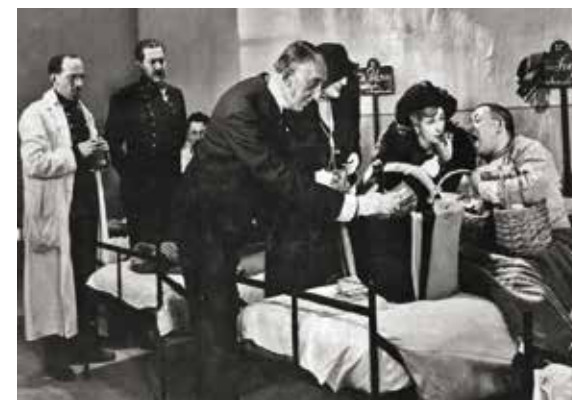
КОМЕДИЯ «БРАВЫЙ СОЛДАТ ШВЕЙК». 1931.