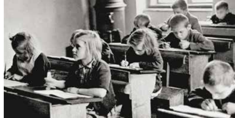
УРОК ПИСЬМА В ПЕРВЫЕ ДНИ ПОСЛЕ ОКОНЧАНИЯ ВОЙНЫ. СИЛЕЗСКАЯ ОСТРАВА, 1945.

Это может показаться невероятным, но с падением империи и созданием независимого чехословацкого государства никаких существенных реформ в системе школьного образования проведено не было. Однако в период Первой республики сильно изменилось его содержание. Так, правительство серьезно откорректировало программу по истории. Значительно больше внимания стало уделяться изучению славянских народов, а вот истории Австрии и Германии, и особенно —