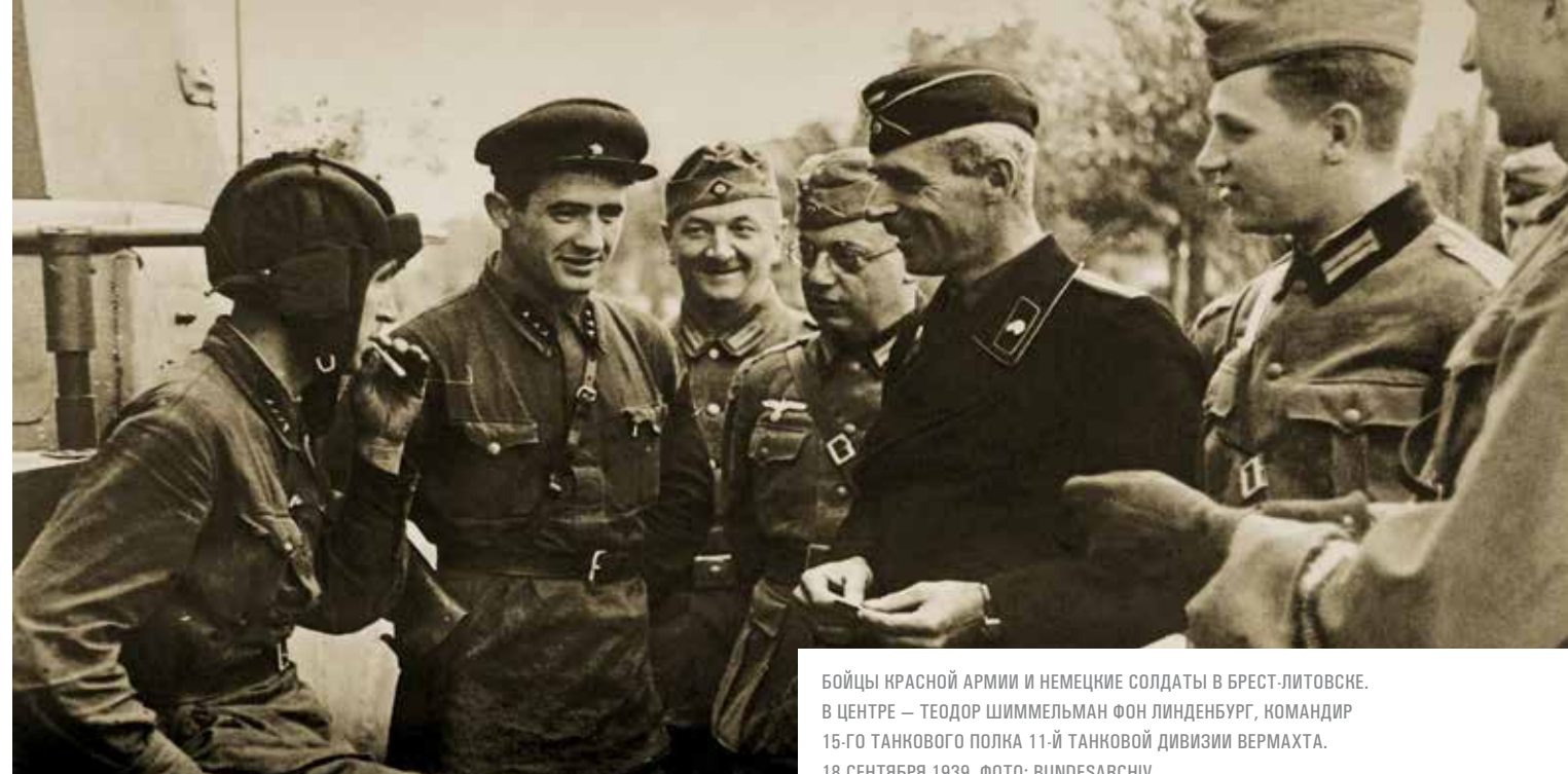
БОЙЦЫ КРАСНОЙ АРМИИ И НЕМЕЦКИЕ СОЛДАТЫ В БРЕСТ-ЛИТОВСКЕ. В ЦЕНТРЕ — ТЕОДОР ШИММЕЛЬМАН ФОН ЛИНДЕНБУРГ, КОМАНДИР 15-ГО ТАНКОВОГО ПОЛКА 11-Й ТАНКОВОЙ ДИВИЗИИ ВЕРМАХТА. 18 СЕНТЯБРЯ 1939.

Последующие семнадцать лет большевики не оставляли планов изменить то, что они считали исторической несправедливостью. Так, в первой половине 1930-х годов московские эмиссары пытались разжечь партизанскую войну на землях со значительным белорусским населением. Правда, безуспешно. А вот на территории бывшей Галиции события развивались совсем в ином направлении. Там зародилось мощное украинское национальное движение, которое в те же годы оформилось в ОУН (Организацию украинских националистов). Отношения между польским и украинским населением были напряженными. Случается, что и по сей день отзвуки тогдашних событий нет-нет да и осложняют отношения между двумя странами.