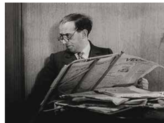
КОМЕДИЯ «ПАН НАЧЕРАДЕЦ — КОРОЛЬ БОЛЕЛЬЩИКОВ». 1932. NÁRODNÍ FILMOVÝ ARCHIV