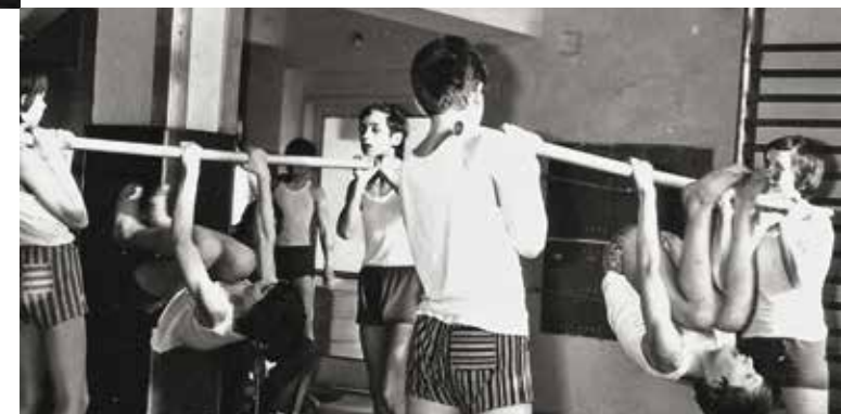
ШКОЛЬНАЯ СПАРТАКИАДА. КРНОВ, 1978.

в городские, и уже там они получали обязательное восьмилетнее образование. Существовала также практика, когда после тщательной расовой, медицинской, социальной и политической проверки семьи детям чешского происхождения разрешалось посещать немецкие школы. Но их не должно было быть более четверти класса. С небольшими изменениями эта система средней школы просуществовала до коммунистической реформы образования 1948 года, которая была проведена по советскому образцу. Это означало фактическую ликвидацию частных, муниципальных и религиозных учебных заведений и окончательное подчинение школы государству. Частные и религиозные школы вновь появились лишь после Бархатной революции.