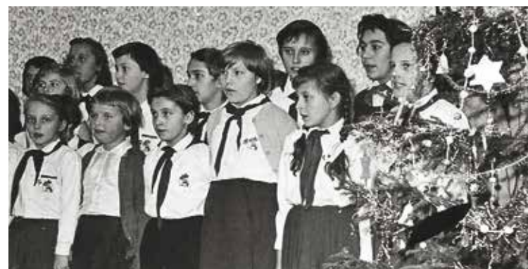
ПРАЗДНОВАНИЕ РОЖДЕСТВА И НОВОГО ГОДА. 1964. ШКОЛА В ЛИБОЦЕ (СЕЙЧАС ЭТО РАЙОН ПРАГИ 6).

роли в ней династии Габсбургов, было отведено существенно меньше учебного времени. Возможно, кто-то увидит параллели с новой редакцией учебника по истории для российских старшеклассников, по которым тем предстоит учиться уже с этого года. Но за видимой схожестью скрыты совершенно разные цели: от пробуждения национального самосознания в Чехословакии до мракобесия и откровенной фальсификации исторических фактов в нынешней России.